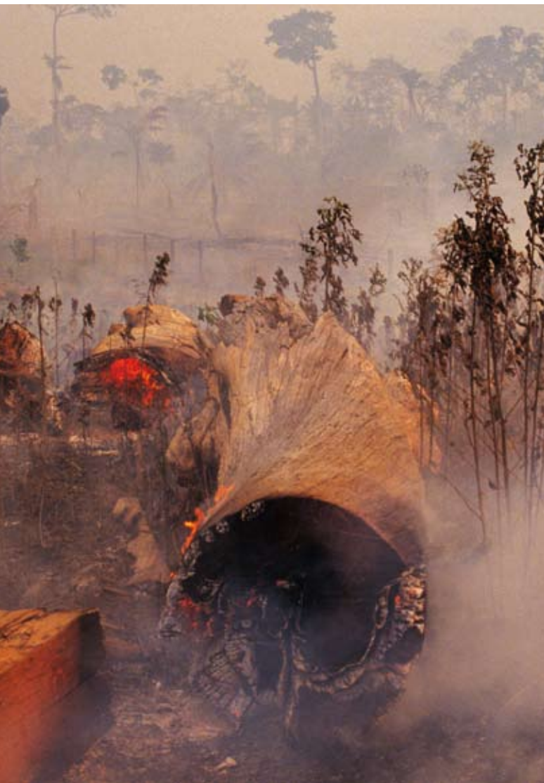
Mark Edwards/Still Pictures