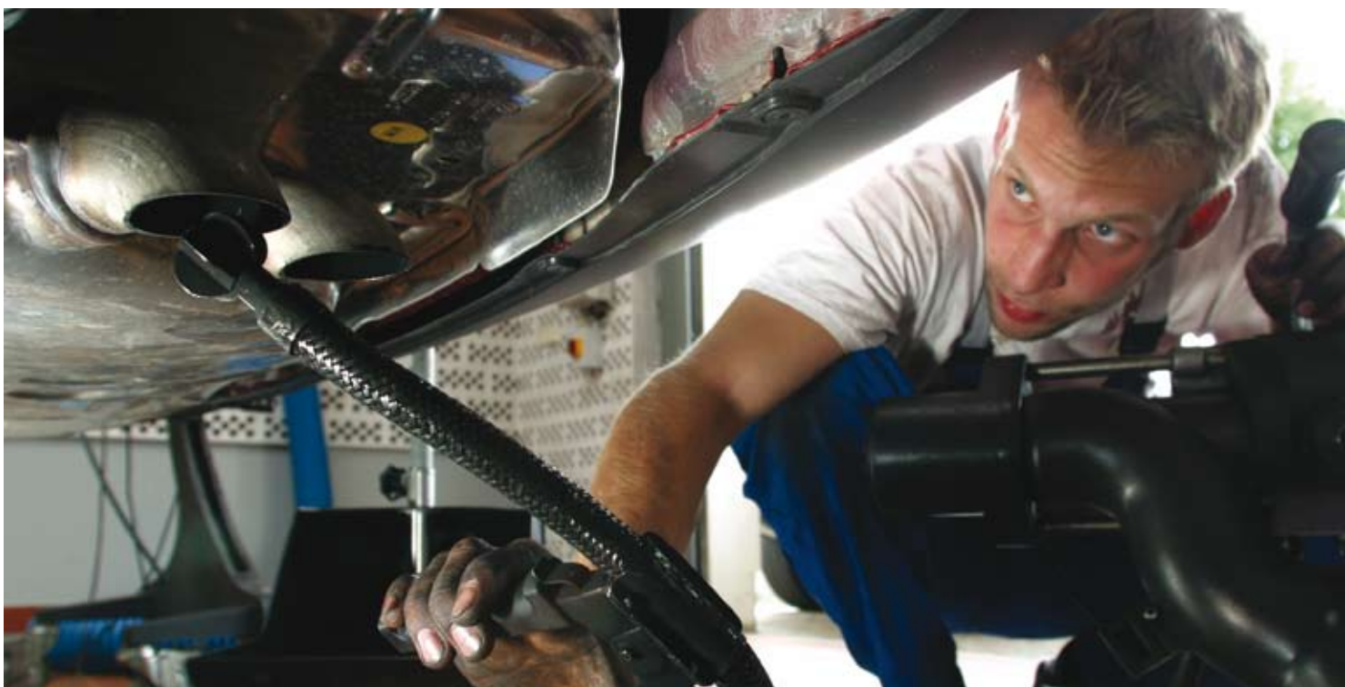
Hartmut Scharzbach/Still Pictures

La industria está llegando rápidamente a una encrucijada. Es poco probable que el desafío del CO 2 desaparezca. Si la economía de los hidrocarburos ha de sostenerse, habrá que enfrentar ese desafío en su totalidad. Las reglamentaciones y normas plantean cada vez más desafíos a las industrias que dependen de los productos combustibles de petróleo para que reduzcan las emisiones y ello está configurando su futura aceptabilidad. La indecisión, quizás por desinformación, ignorancia o el hecho de no comprender el sentir del público, puede señalar el comienzo del final de una industria que ha brindado combustibles al mundo ►