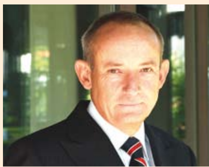
YVO DE BOER

En los países industrializados se está empezando a avanzar en la reducción de las emisiones de gases de efecto invernadero como resultado del Protocolo de Kyoto y a través de sus mecanismos flexibles. El Protocolo se relaciona con el mundo en desarrollo, por ejemplo mediante el Mecanismo para un Desarrollo Limpio (MDL), que permite a los países desarrollados compensar las emisiones (por ejemplo mediante proyectos de forestación y fuentes