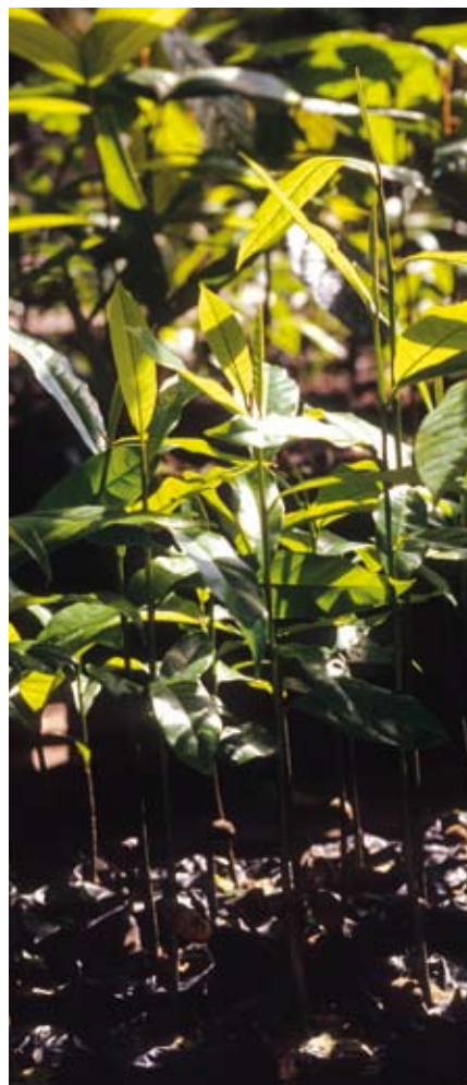
Mark Edwards/Still Pictures

JOSÉ GOLDEMBERG pide a los países desarrollados y a los países en desarrollo más adelantados que tomen medidas inmediatas