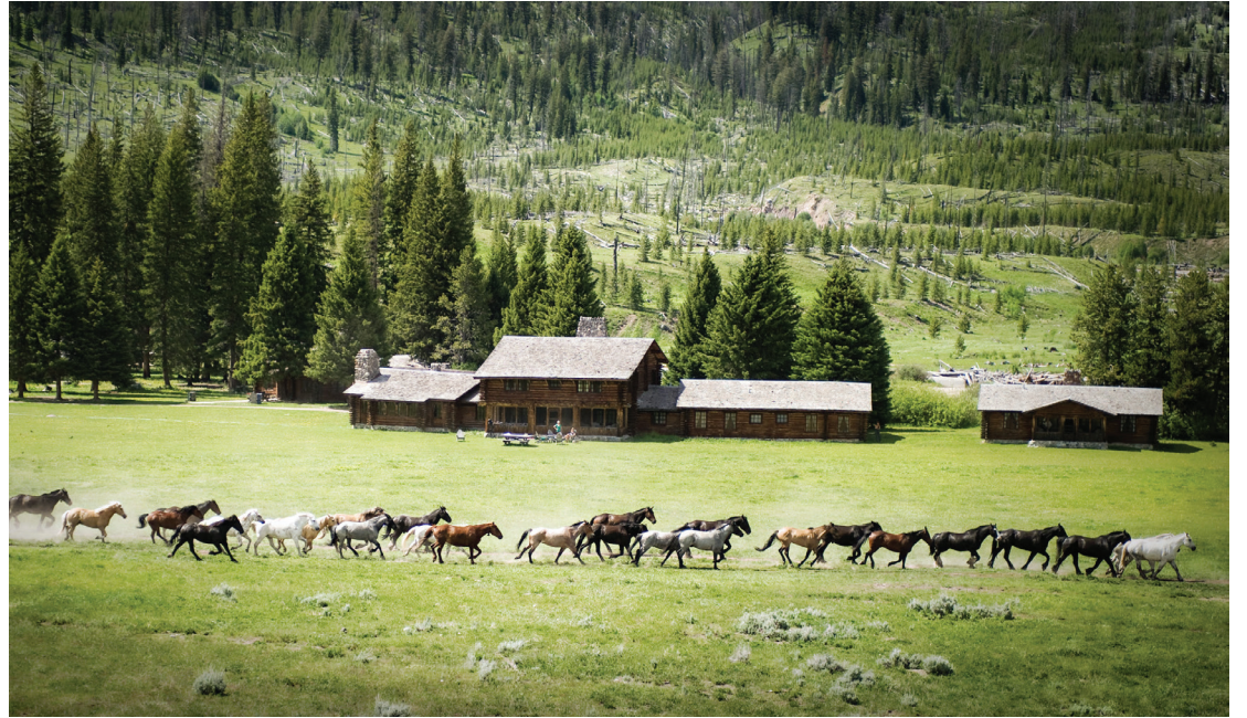
رعي الخيول على المرح، مونتانا بالولايات المتحدة الأمريكية، بعدسة تراسي راتكليف / فليكر (رخصة مشاع إبداعي - استعمال غير تجاري - الترخيص بالمثل)