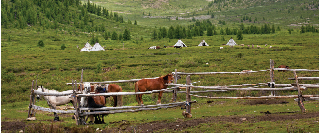
المخيم الصيفي لرعاة الرئة من شعب الدوخة في شرق تايبغا في منغوليا، بعدسة لورنس هيزلوب / مؤسسة غريد - أريندال

كما يجب أن تغطي الإحصاءات الحكومية عن الرعاة والمراعي المسائل التي تستقطب اهتماماً عالمياً، مثل النزاعات والأمن البشري،