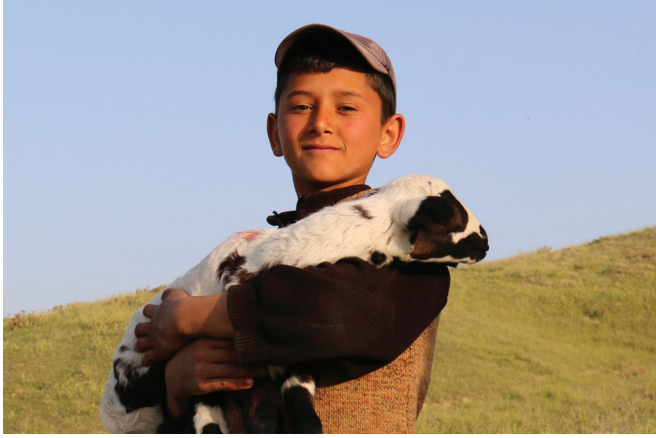
فتى من رعاة البدو، تركيا

للرعي والمراعي أهمية عالمية، لكنها لا تتال حق قدرها وقيمتها.