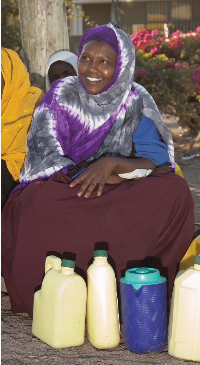
نساء يبعن الحليب في إيزيولو في كينيا

ينبغي للتقييم العالمي المتكامل أن يغطي القضايا الاجتماعية الاقتصادية والفيزيائية، ونمط تفاعل الأنظمة الرعوية مع عناصر المجتمع الأخرى، والتوجهات السابقة والسيناريوهات المستقبلية. ويجب أن يتمكّن التقييم من جمع بيانات عالية الجودة ويمكن التحقق منها، سواءً كانت جديدة أم موجودة مسبقاً، بما في ذلك البيانات الميدانية الأولية حول الفجوات في المجالات التي لم يتم جمع بياناتها من قبل، وتضمين نماذج جديدة، والمعارف التقليدية، والتفكير الابتكاري. يجب معالجة الفجوات المعرفية بالاعتماد على مزيج من بيانات الاستشعار عن بعد والبيانات المجمعة على المستوى المحلي من خلال التعاون مع الرعاة. وينبغي تحديث التقييم بشكل دوري.