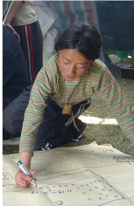
راعية من التبت ترسم خارطة استخدام المراعي

توصلت الدراسة إلى أن المنشورات الأكاديمية تتضمن كمّاً أكبر بكثير من المعلومات عن قضايا مثل المروج والماشية بالمقارنة مع قضايا الرعي والمراعي على وجه التحديد. فضلاً عن ذلك، تحظى القضايا المتعلقة بالرعي بتغطية ضعيفة بالمقارنة مع المؤلفات التي تتناول قضايا المراعي، كما أن قلة قليلة فحسب من المنشورات تغطي الرعي والمراعي بأسلوب متكامل.