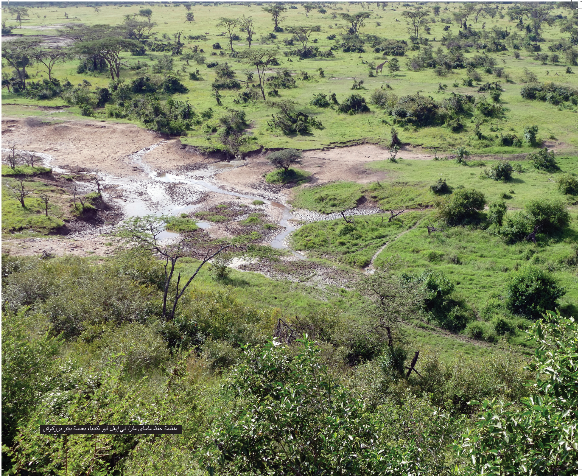
منظمة حفظ ماساي مارا في اينغل فيو بكينيا