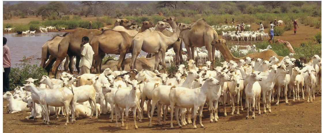
ماعز وإبل في الصومال عند نقطة سقاية