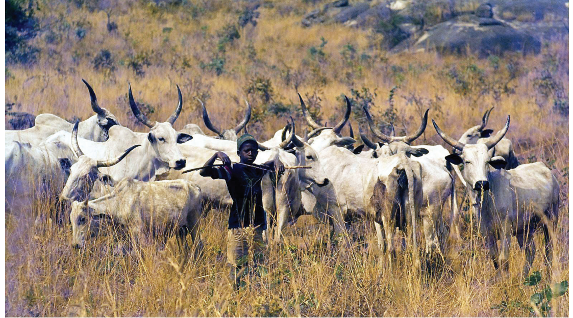
راع فولاني في وسط نيجيريا

بما أنه لا يوجد حالياً تعريف أو منهجية أو مجموعة مؤشرات أو خطوات أو هيكلية معيارية لجمع المعلومات عن الرُّعاة والمراعي (رغم أنها قد تتوفر قريباً من أجل الغابات، وذلك بفضل وجود منتدى حكومي دولي)، فمن المتعذر مقارنة مجموعات الإحصاءات والبيانات. ويتم العمل على مواءمة المصطلحات المتعلقة بالمراعي، لكن ليس تلك المتعلقة بالرُّعي.