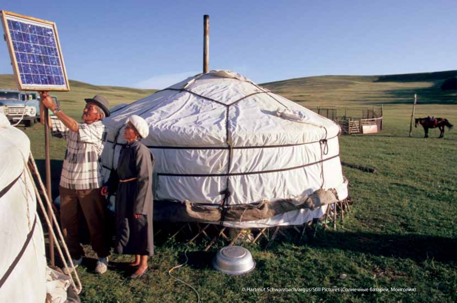
(Солнечные батареи, Монголия)