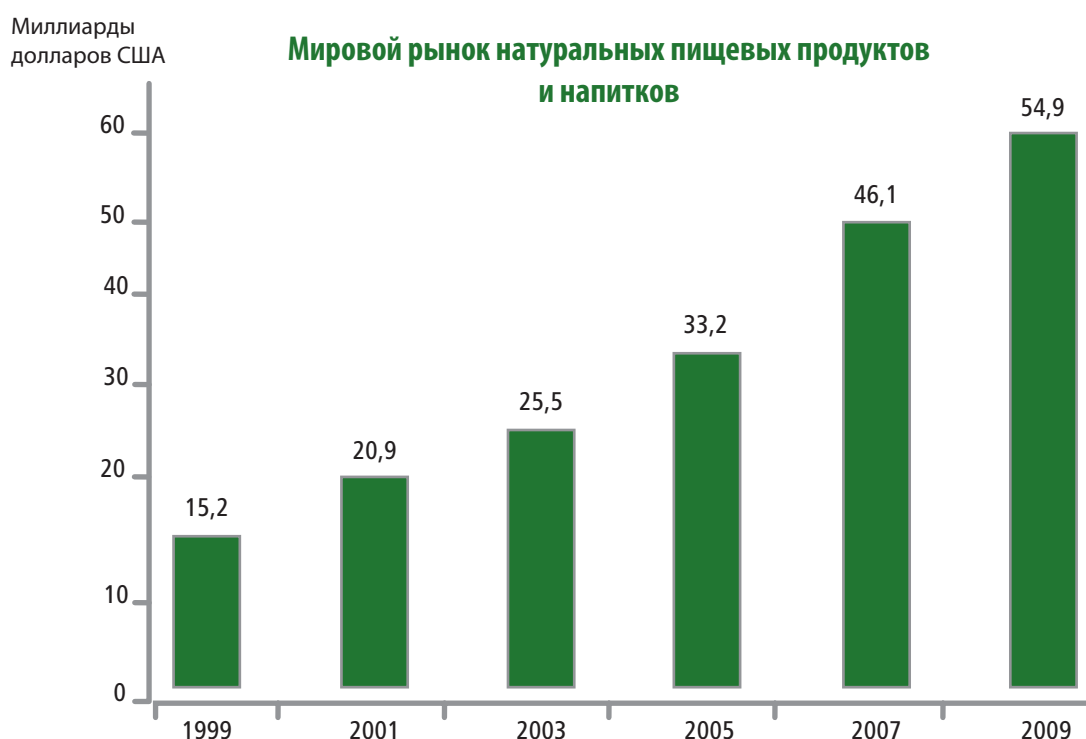
Рисунок 1. Объем мировой торговли органическими продуктами питания и напитками (1999–2009 гг.)

В контексте подготовки «Рио+20» большинство дискуссий о торговле и зеленой экономике сфокусировано на рисках и вызовах, связанных с переходом к зеленой экономике. Основное беспокойство вызывает тот факт, что концепция зеленой экономики и ее международное одобрение в качестве цели национальной политики может создавать «прикрытие» для неоправданных протекционистских мер или ограничений международной торговли конкретными товарами или услугами, если эти товары или услуги не считаются «зелеными». Это беспокойство связано с рядом конкретных политических мер, таких как стандарты, права интеллектуальной собственности или субсидии, которые, с одной стороны, могут внедряться для защиты окружающей среды и стимулирования рынков экологических товаров и услуг или инноваций в области экологически чистых технологий, а с другой стороны, могут также защищать местные отрасли от иностранной