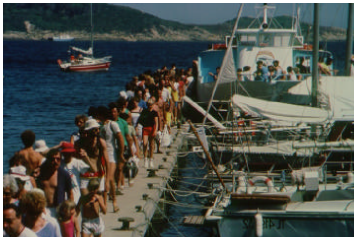
Les activités balnéaires sont les principales sources de perturbation des écosystèmes marins.