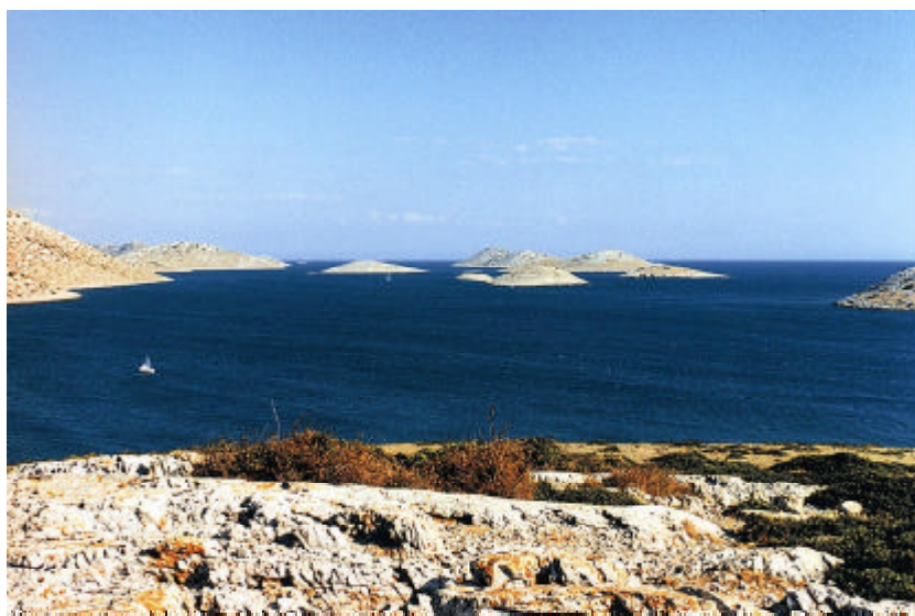
Parc National des Iles Kornati. D.Grica

Dix aires protégées jalonnent le littoral croate, 5 parcs nationaux et 5 réserves naturelles : Parc National des Iles Brini, Parc National des Iles Kornati, Parc National de Krka, Parc National de Paklenica, Parc National de Mljet, Réserve Naturelle de Limski Zaljev, Réserve Naturelle de Lokrum, Réserve Naturelle de Malostonski Zaljev, Réserve Naturelle du Delta de la Neretva (site Ramsar), Réserve Naturelle de Suma Dundo na Rabu (Forêt de Dundo – Ile de Rab).