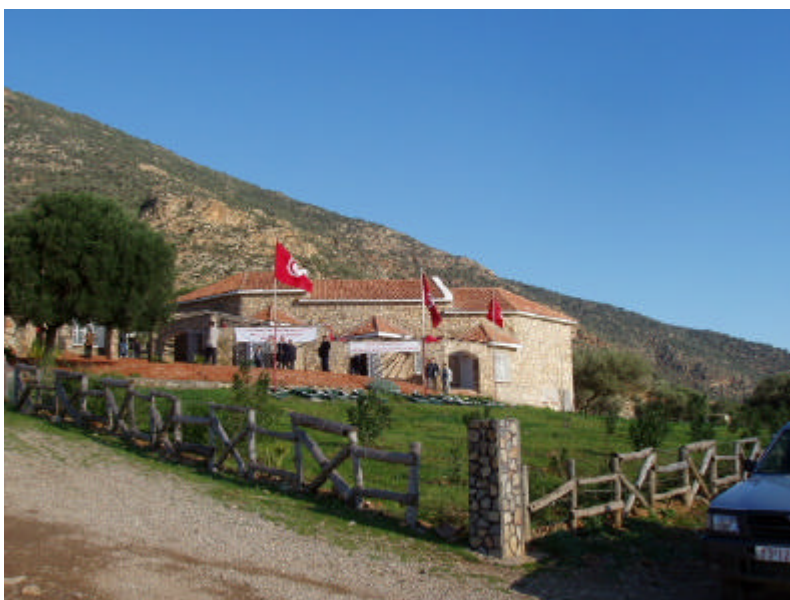
Les centres d'information situés à l'intérieur ou près des zones à aménager jouent un rôle très important dans la mise en œuvre des plans de gestion.

Les utilisations nombreuses et souvent conflictuelles des zones côtières et des zones humides rendent nécessaire une intervention organisée pour l'allocation des ressources et la conservation de l'héritage naturel et culturel. Dans plusieurs pays, il est considéré, par expérience, que cela est mieux fait à travers des Plans d'Aménagement Côtier Intégré (PACI), préparés par des équipes multidisciplinaires en étroite liaison avec les conditions et les réalités locales. Une méthodologie appropriée a été déjà développée et une expérience considérable acquise dans la préparation de tels plans de gestion 40 . Un effort de collaboration internationale pour la revue de la planification de la gestion des zones côtières sensibles en Méditerranée, aux fins d'en simplifier la mise en œuvre, est hautement utile. Un travail supplémentaire doit être fait pour adapter les plans côtiers de caractère plus général aux sites spécifiques.