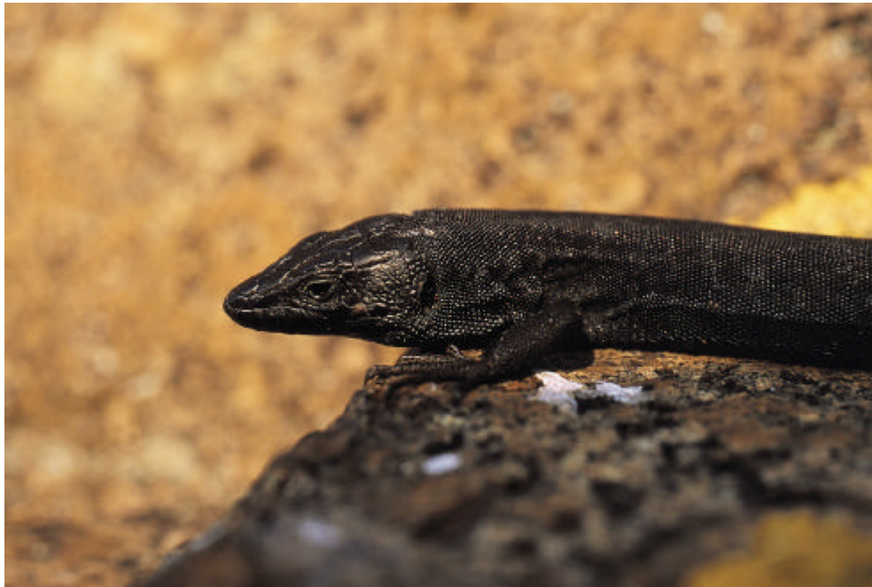
Podarcis melisellensis ssp Lizard endémique de la Croatie de l'île de Jabuka.

Il est à noter ici que les connaissances sur les poissons d'eau douce, très importants dans la région, sont limitées et que cela mérite une plus grande attention 26 .