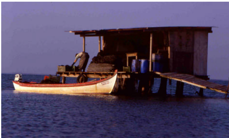
Dans certains zones humides se pratiquent des activités traditionnelles qui font partie de l'histoire d'une nation. La culture des moules est parmi ces pratiques.

Il est souhaité que cette approche supplémentaire puisse aider à la reconstruction des relations traditionnelles entre les populations locales et leurs zones humides et à l'attraction des visiteurs qui apporteront des bénéfices aux économies.