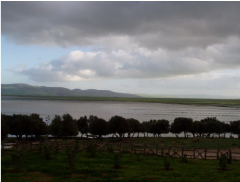
Le lac Ichkeul ; Une zone humide Ramsar d'importance internationale.

Quelques-uns des sites Ramsar ont été inscrits dans le Montreux Record ; ce qui indique que ces derniers peuvent être le siège de sérieux changements écologiques et, de ce fait, mériter une plus grande attention et des ressources pour les conjurer. Il existe 18 sites Montreux en Méditerranée. Malheureusement cet outil utile n'a pas été utilisé d'une manière active dans l'identification des sites sensibles et son fonctionnement devrait être reconsidéré.